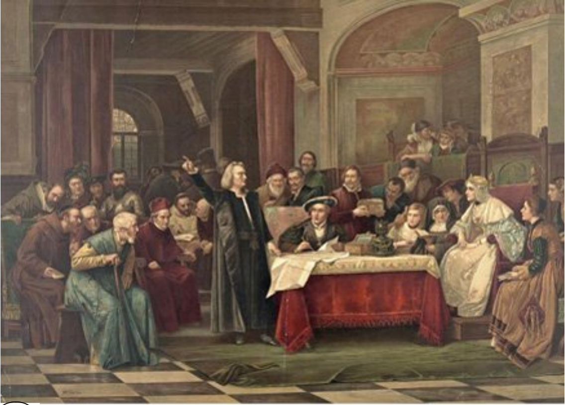
২ রানী ইসাবেল্লা আর রাজা ফার্ডিনান্ডের সামনে "ভারত" আবিষ্কারের প্রস্তাব নিয়ে ক্রিস্টোফার কলম্বাস