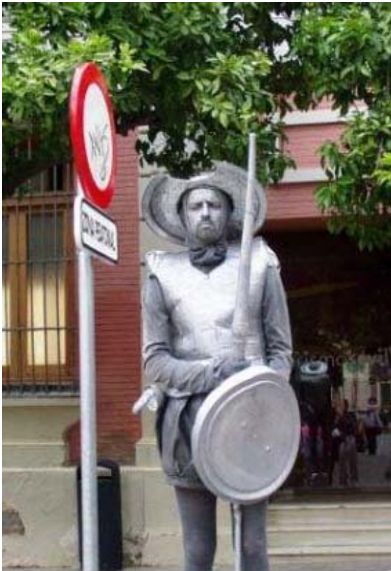
২৯ সেভিল্লার রাজপথে মধ্যযুগীয় সৈনিক ।