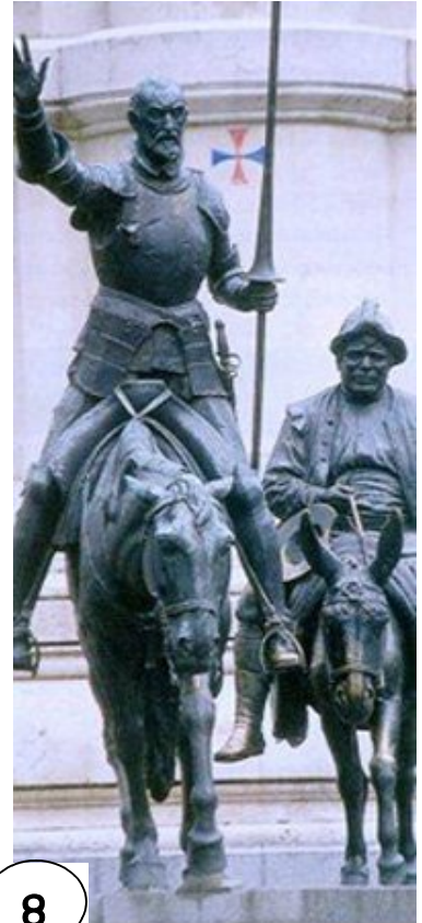
৪ ডন কিহোটে ও সান্চো পাঞ্জা মাদ্রিদের প্লাজা দ্য এম্পানায় মর্মরমূর্তি