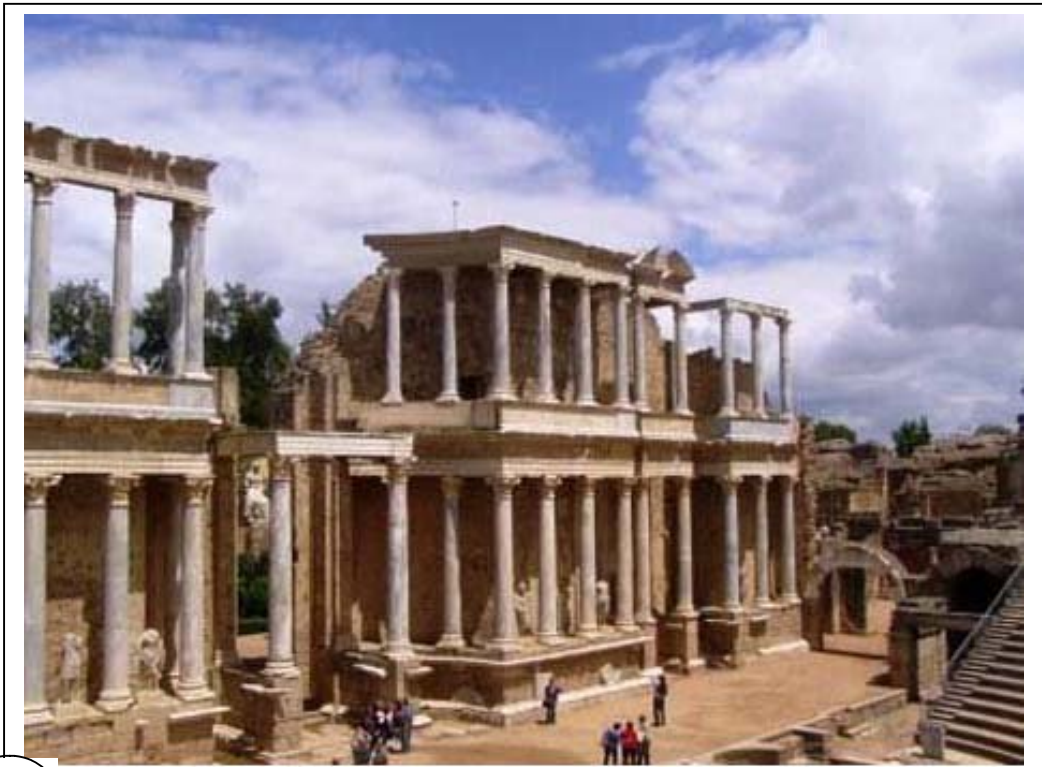
ফেডো শুলগ্রস্ত শ্রীচ ।