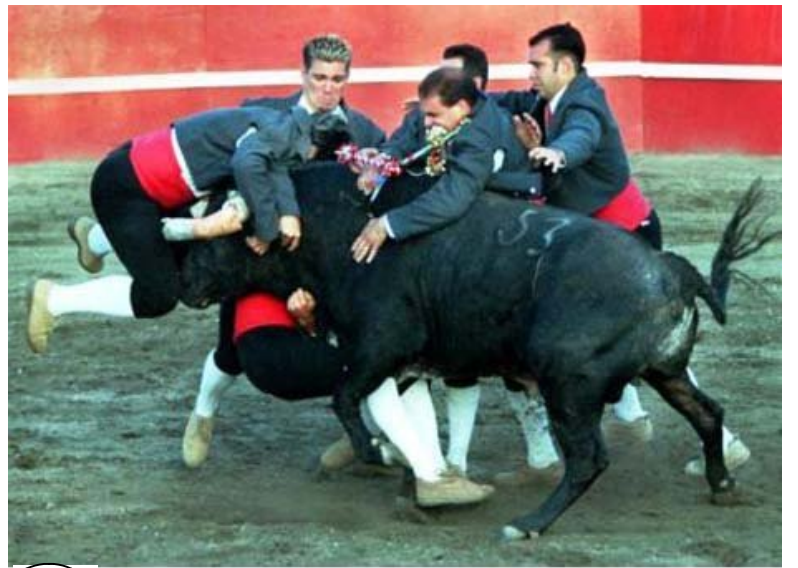
৩০ পর্তুগীজ বুলফাইট -- আটজন মানুষ থাকার কথা কিন্তু ।