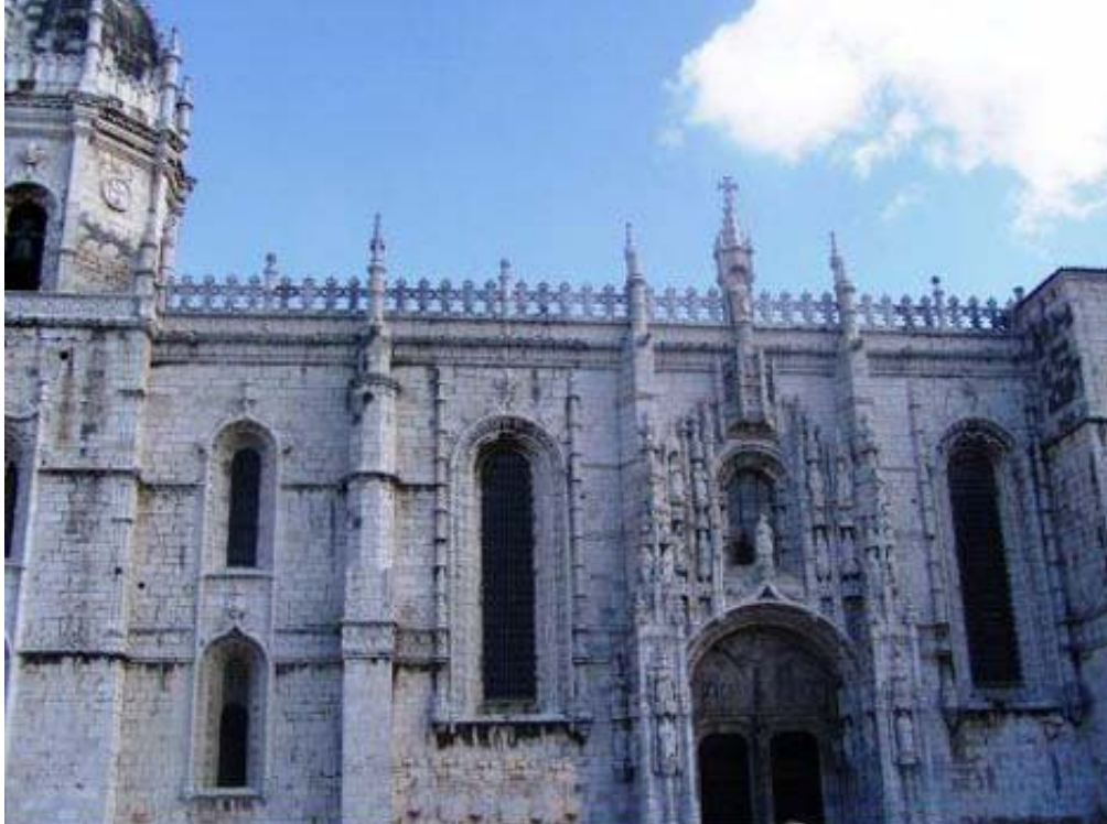
২২ লিসবনে সন্ত জেরোনিমোর গির্জা -- দেয়ালের ছায়াতলা দেখা যাবে একটু খুঁজলে ।