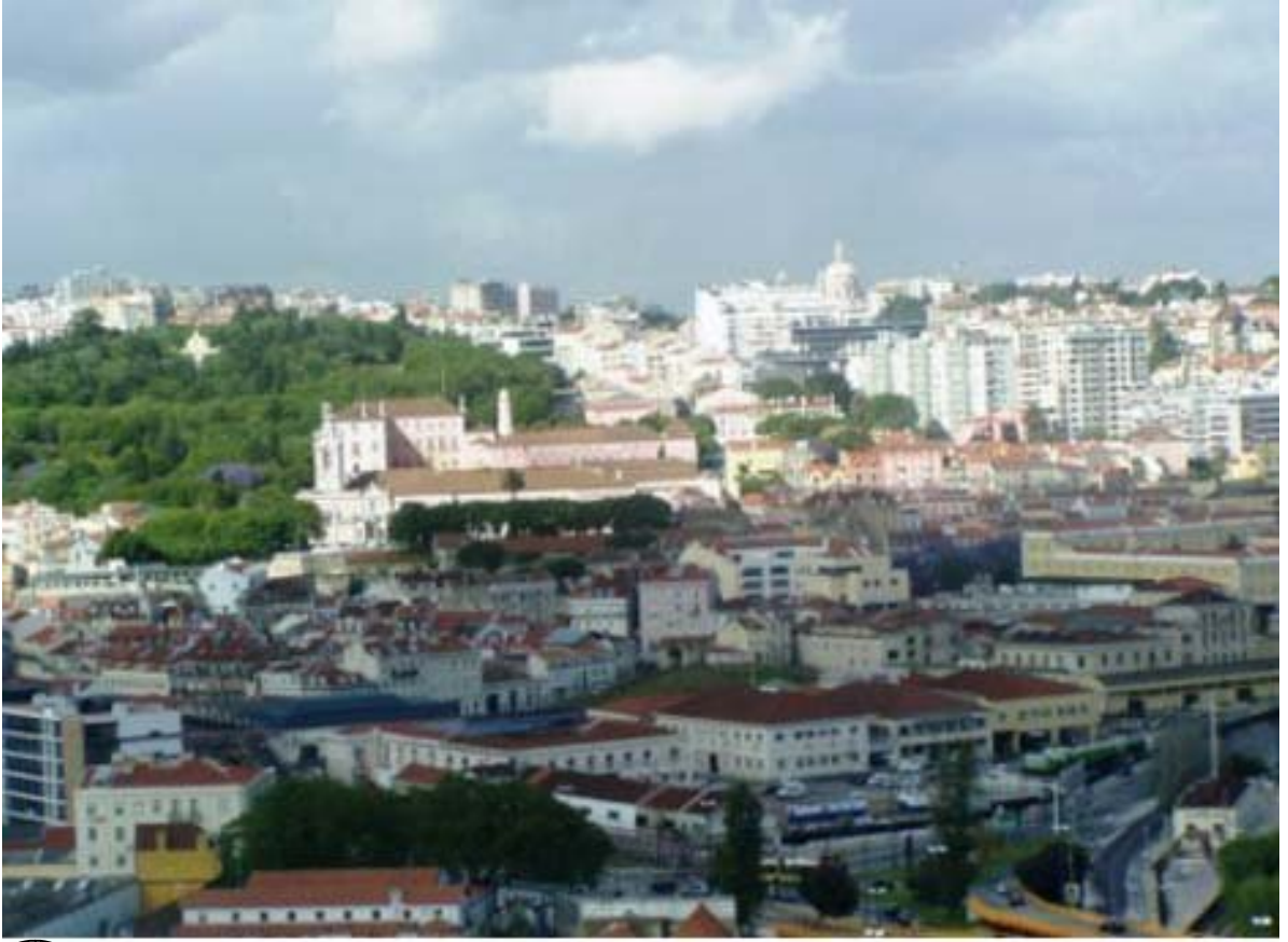
২১ আলোতে ছায়াতে লিসবন শহর ।